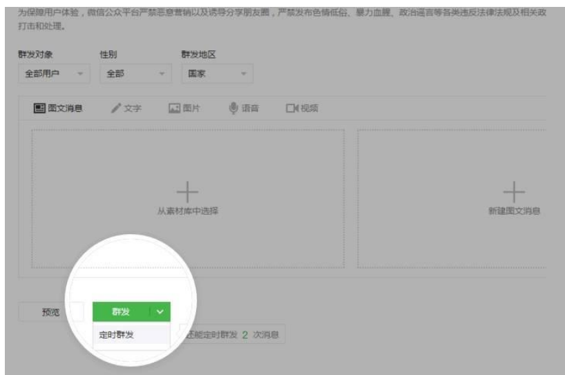
รูปที่ 3 หน้าอินเตอร์เฟซของฟังก์ชันส่งกลุ่ม