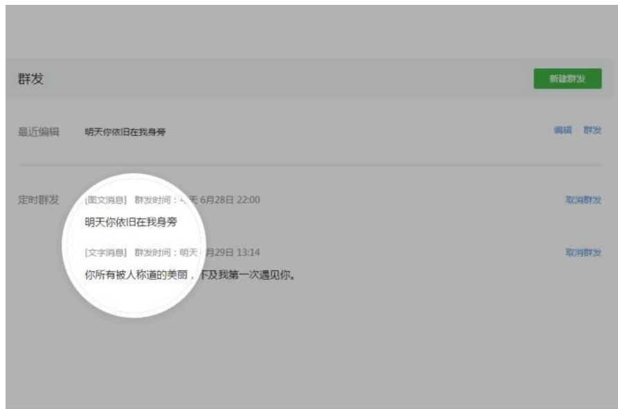
รูปที่ 5 ลิสต์กำหนดเวลา