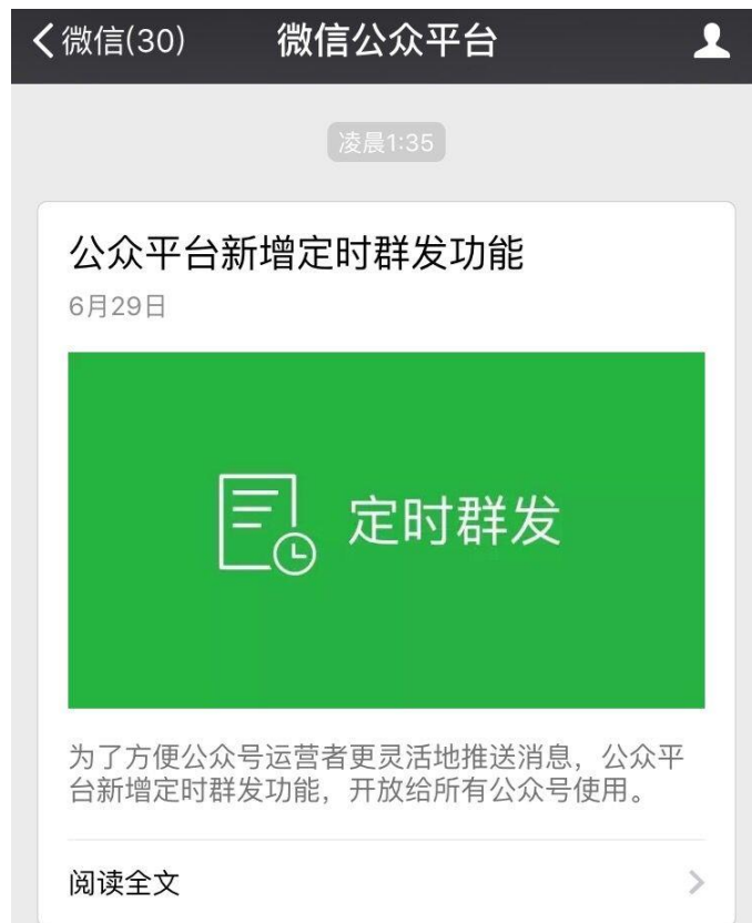
รูปที่ 2 ประกาศฟังก์ชันกำหนดเวลาส่งกลุ่ม