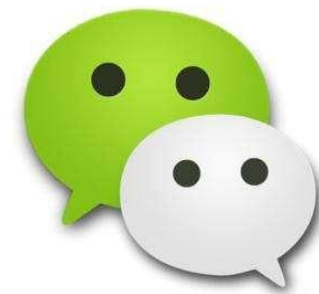
图 1 微信图标